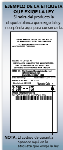
TABLA DE CÓDIGOS DE GARANTÍA

La cobertura de la garantía rige a partir de la fecha original de la compra. El reemplazo del colchón o de la base no extiende el período de garantía limitada ni implica el comienzo de un nuevo período de garantía limitada. Su período de garantía se determina en función del código impreso en la etiqueta blanca que exige la ley, según se indica en la siguiente tabla de códigos de garantía.